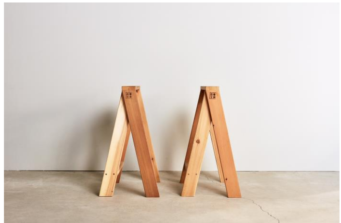
■AA HIGH STOOL : Photo by Yosuke Owashi

店舗デザインは、「GOOD DESIGN EXHIBITION 2018」の会場デザインを行うトラフ建築設計事務所によるもの。会場でも使用される AA STOOL を高さ約 3.8m に巨大化させたシンボルを中心に、人の賑わいあふれるマルシェのような店舗を設計。