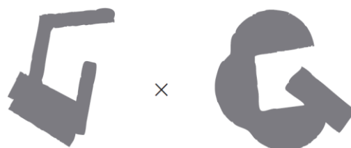
GOOD DESIGN, Good Job!

グッドデザイン賞受賞のグラスを生地に使用し、コラボグラフィックのGXGが転写プリントされた仕様になっています。